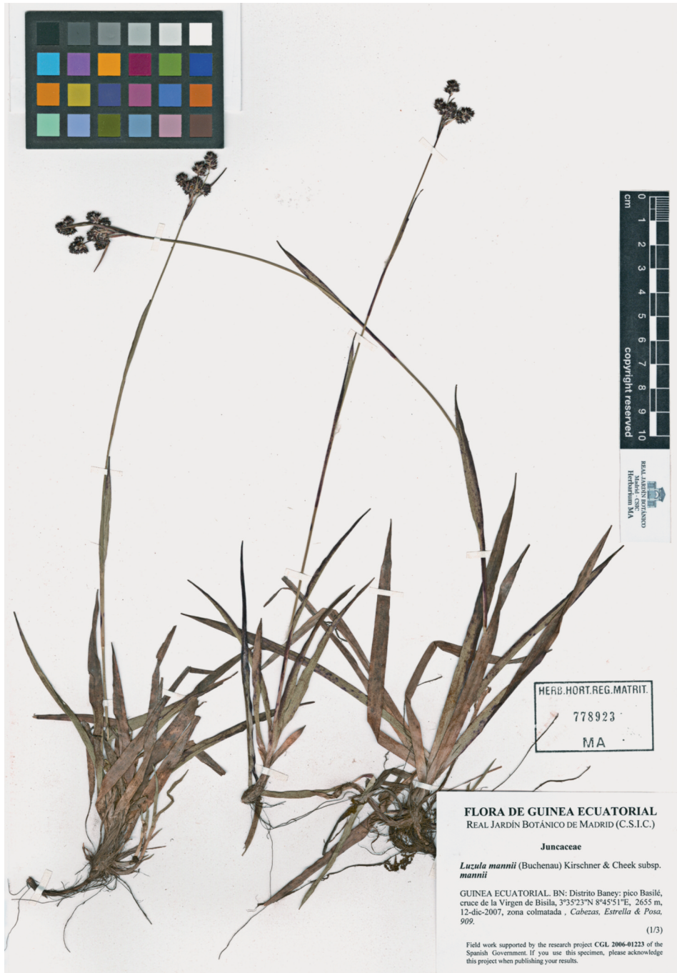
Fig. 136. Luzula mannii subsp. mannii