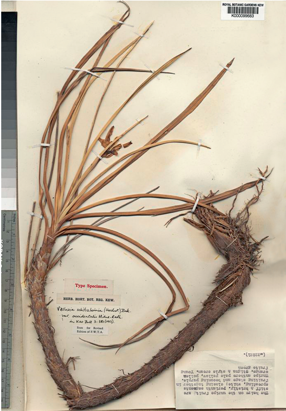
Fig. 2. Xerophyta schinzleinia